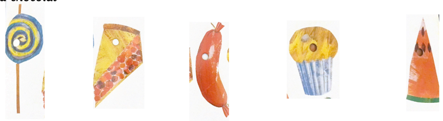
une sucette une tarte aux. aux cerises une saucisse un petit gâteau la pastèque