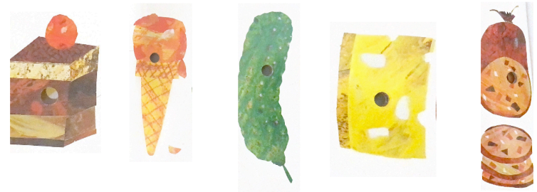
un gâteau au chocolat une glace. un cornichon. le fromage un saucisseon