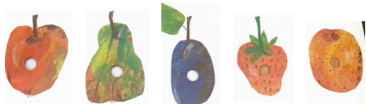
une pomme une poire. une prune une fraise une orange